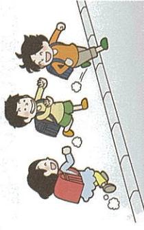
④信号が青だと、無警戒に横断しがち…