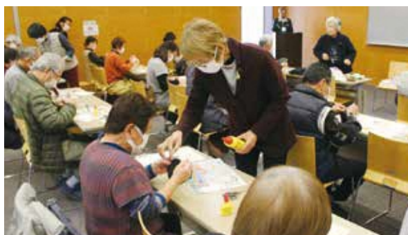
楽らく隊による創作体験

本会でも引き続き、サロンの運営支援とともに、ミニサロン新規設立のサポートを行ってまいります。関心のある方は、お気軽に本会までお問い合わせください。