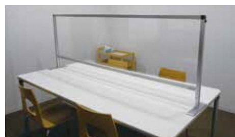
いきいきプラザ1階 共用相談室 看板が目印です

毎月第2・第4水曜日（祝日、2月の第4水曜日は除く） 午前9時～12時 ※2月のみ会場の都合により第3水曜日となります。