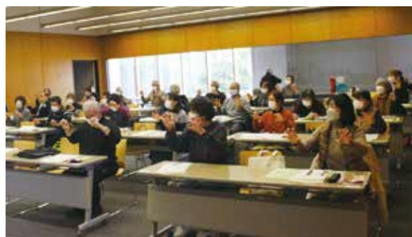
在宅介護支援センターによる健康づくり運動体験