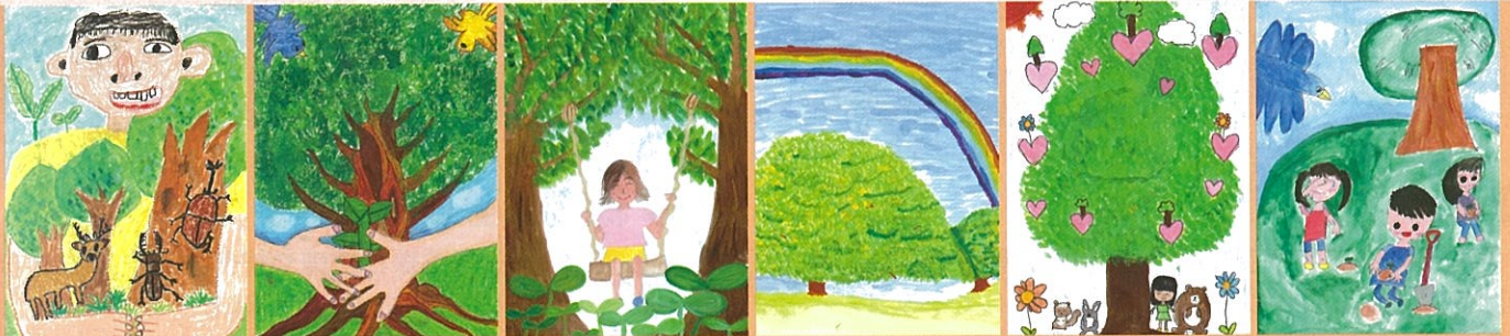
令和6年用国土緑化運動・育樹運動ポスター原画コンクール栃木県推薦作品

「緑の募金」は県民の皆さまからの善意のご寄附によりなりたっております。 ご協力をいただきました多くの皆さまに、心からお礼申し上げます。