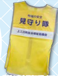
地域の安全見守り隊ベスト