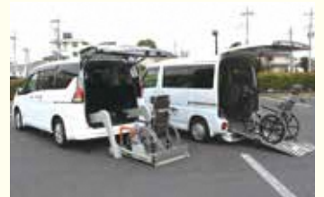
福祉車両貸出事業