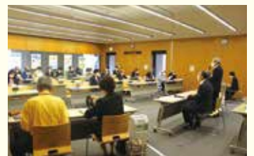
民生委員児童委員・福祉協力員合同研修会