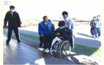
ふくしアクションプログラム事業