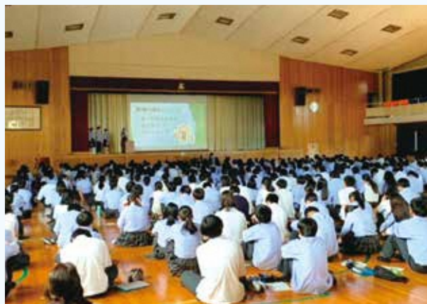
特別授業発表会の様子

発表会では、誰もが利用しやすく、地域とのつながりが密接な「開かれた学校」の実現に必要な実践方法についてまとめ、全校生徒へ発信しました。