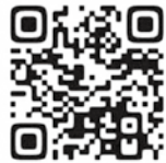
矯正職員採用広報HP