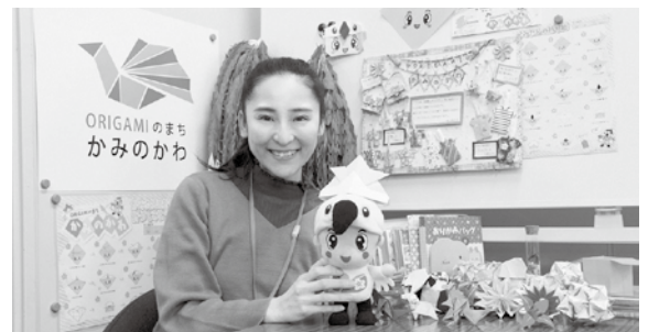
折り紙に溢れています