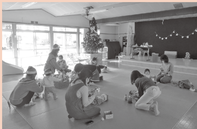
【12月のベビーサロンの様子】クリスマスの飾りを作りました