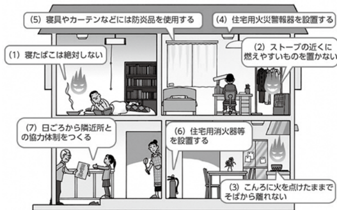
政府広報オンラインより引用