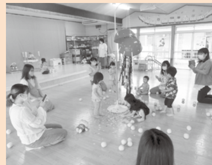
【9月のベビーサロン(左)、キッズサロン(右)の様子】 ミニ運動会をし、親子で楽しみました。