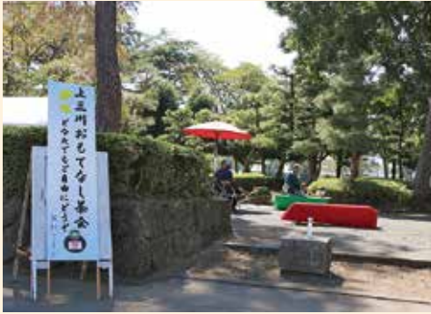
上三川おもてなし茶会

おもてなしとして、無料ドリンクコーナーやCafé Kamitan、上三川おもてなし茶会を実施しました。 Café Kamitanでは、上三川の水で淹れたコーヒーと、日替わりでかみのかわブランドのお菓子や町の菓子店、町内外の福祉作業所の方が作ったお菓子を選手・監督や一般観覧者に配りました。