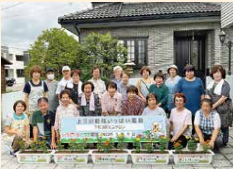
下町3区ミニサロンの皆さん

花いっぱい運動では、町内の小中学校と下町3区ミニサロンの皆さんが育てた歓迎・応援メッセージ入りの花プランター約150基を会場に飾り、選手をお迎えしました。 また、町造園協力会の皆さんに花プランターをいただきました。