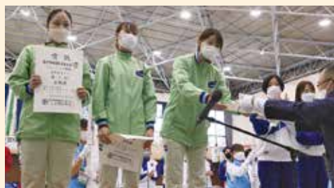
成年女子エペ：京都府