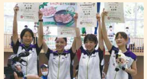
少年女子フルーレ：東京都