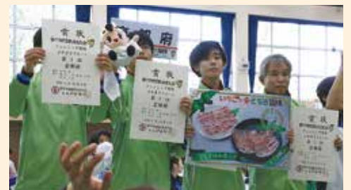
少年男子フルーレ：京都府