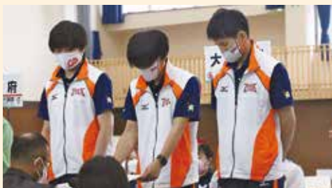
成年男子フルーレ：大分県