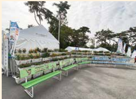
会場に飾られたプランター