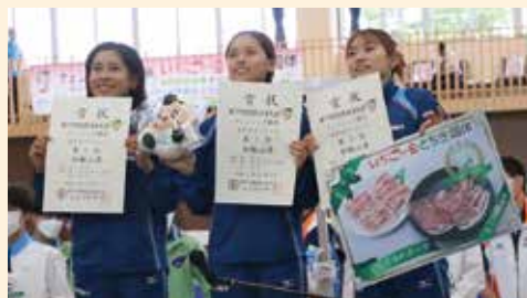
成年女子フルーレ：和歌山県