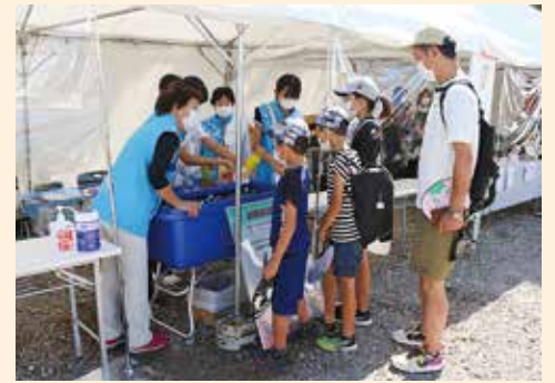
無料ドリンクコーナー