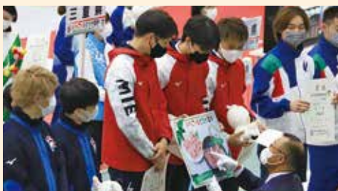
成年男子サーブル：三重県