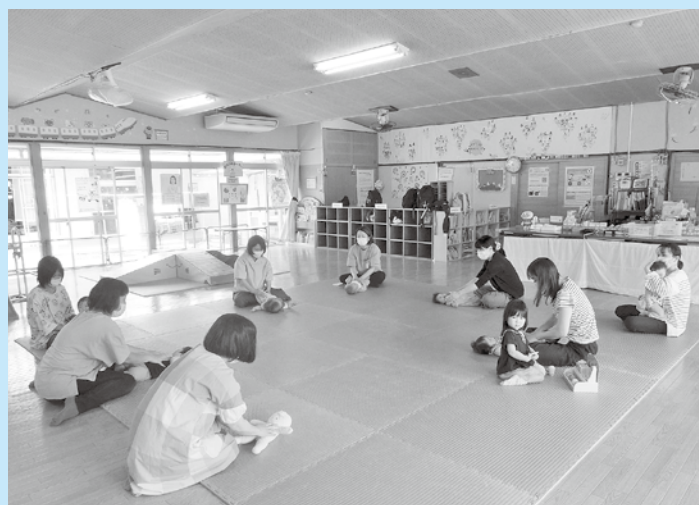
【ベビーサロンの様子】 音楽に合わせて触れ合い遊びをしています。