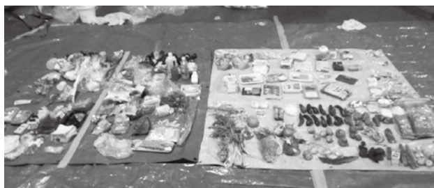
【食品ロス実態調査時の直接廃棄物(一部)】