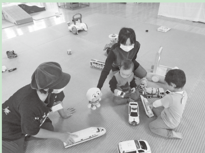
【普段の様子】 ママやお友達と一緒に楽しく遊んでいます。

(新型コロナウイルス感染症の状況により、定員数に変更となる場合があります。) ※6月3日(金)より、センター内、または電話にて受付開始。