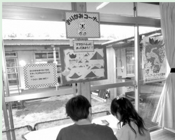
【おりがみコーナー始めました】 何を折ろうかな？ママと一緒に折っています。

(新型コロナウイルス感染拡大の状況により、定員数に変更となる場合があります。) ※5月10日(火)より、センター内、または電話にて受付中。