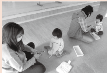
【キッズサロンの様子】 ママと一緒におもちゃ作りをしました。