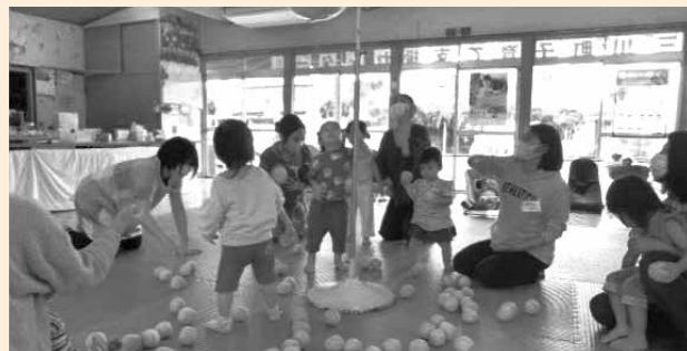
【9月のキッズサロンの様子】 ミニミニ運動会をし、親子でいい汗を流しました。