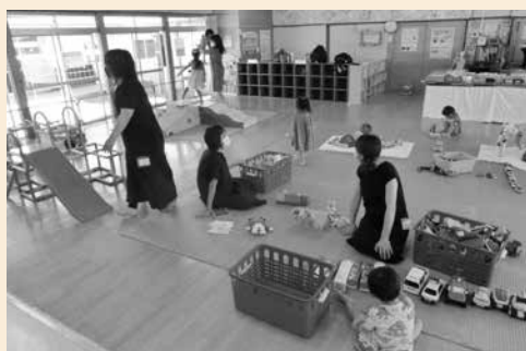
【普段の様子】 小さい子から大きい 子まで、楽しく遊ん でいます。