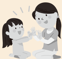
【7月のサロンの様子】 ママたちも体を動かし、 ストレスを発散しました。

▼問い合わせ先 子育て支援センター ☎56 2043 詳細は、センターや町ホームページでご確認ください。