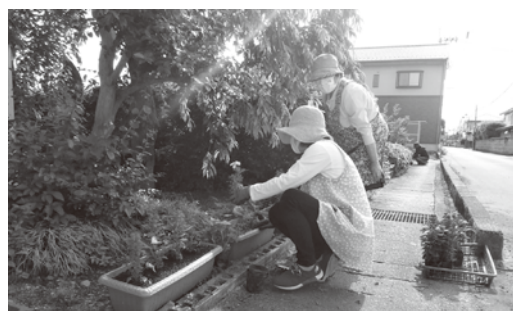
東蓼沼西自治会での花いっぱい運動