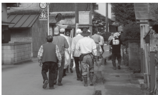
東蓼沼西自治会での環境美化運動

5月29日及び30日、町内各所において新型コロナウイルス感染拡大防止対策を講じた上で、町をきれいにする統一美化キャンペーンが行われました。環境美化運動では、公道などに捨てられている空き缶などのごみが回収され、花いっぱい運動では、町内の主要な箇所にサルビア、マリーゴールドなどを植えました。