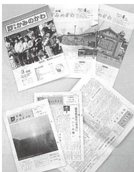
歴代の広報誌 ※右下が創刊号

広報1000号が出る予定の西暦2048年は、一体どんな町になっているのでしょうか。