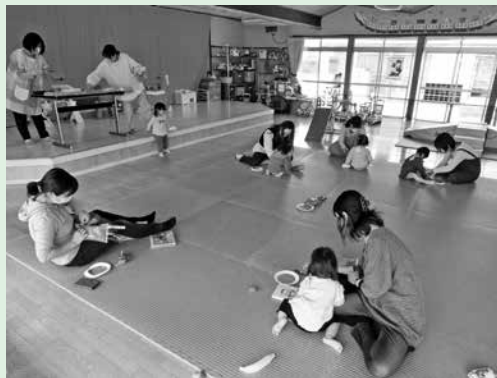
【キッズサロンの様子】

午前の部、午後の部どちらか都合の良い方をお申し込みください。 ※詳細は、センターや町ホームページでお知らせしております。