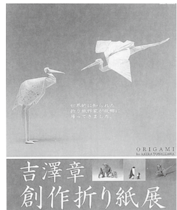
当時の折り紙展の案内チラシ

今号では平成15年の出来事を紹介します。記憶に残るところでは、イラク戦争の開戦や新型肺炎SARSの流行などが挙げられます。小惑星探査機「はやぶさ」が打ち上げられたのもこの年です。町内の出来事では、