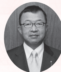
上三川町長 星野 光利