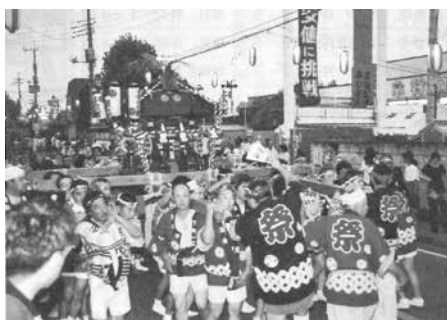
町おこし夏祭りの様子