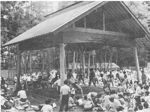
平成3年8月の土俵開きの様子