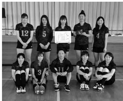
優勝した Twinkle のみなさん

11月24日 本郷小学校 優勝 Twinkle 準優勝 ヴァルキリー 第3位 やしおべりー