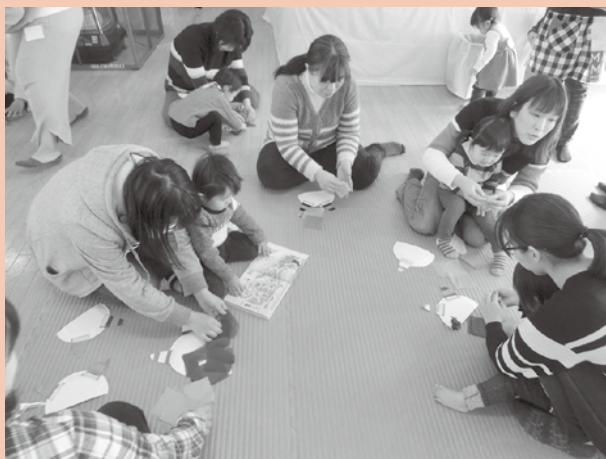
[昨年の豆まきの様子]