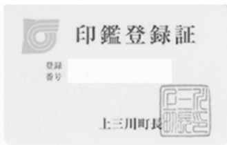
〈窓口で利用できる〉