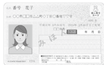
〈窓口とコンビニで利用できる〉