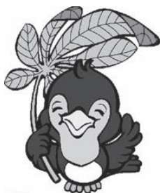
県民の日マスコット「ルリちゃん」

6月15日は県民の日です。記念イベント等、詳しくは県ホームページやイベントガイドをご確認ください。