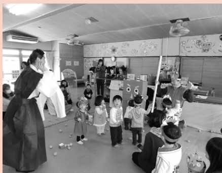
【昨年の豆まきの様子】 元気に豆をまいて悪い鬼をやっつけました。