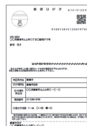
【交付通知書(ハガキ)】

申請から約1か月半後に、役場より交付通知書(ハガキ)をお送りします。申請者本人が、交付通知書に記載されている期限までに、必要な持ち物を持参して、受け取りに来庁してください。