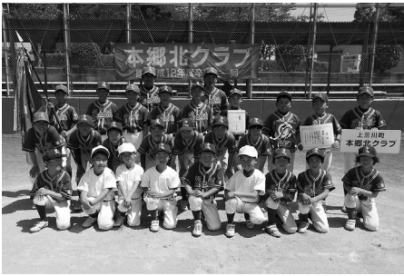
優勝した本郷北学童野球クラブのみなさん