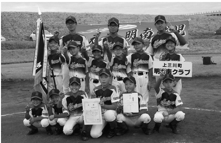
優勝した明治南クラブのみなさん

4月1日・7日 蓼沼緑地公園 優勝 〓 明治南クラブ 準優勝 〓 本郷北学童野球 〓 本郷クラブ ※準決勝進出チーム(ベスト4)は、高円宮賜杯第5ブロック予選会の上三川支部代表 ※優勝の明治南クラブは、第11回Gas Oneカップ県大会も代表になります。