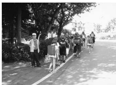
スクールガード見守隊

世話になりながら子どもたちの安全、安心に努めます。さらに、教師の多忙感については、教育事務のスリム化等を調査中です。