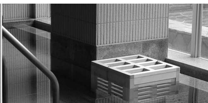
いきいきプラザの人工温泉

を図るため、北側玄関のひさし部分に照明を設置します。また、お風呂の魅力アップのため、室内の浴槽に人工温泉薬石設置など、改善を予定しています。