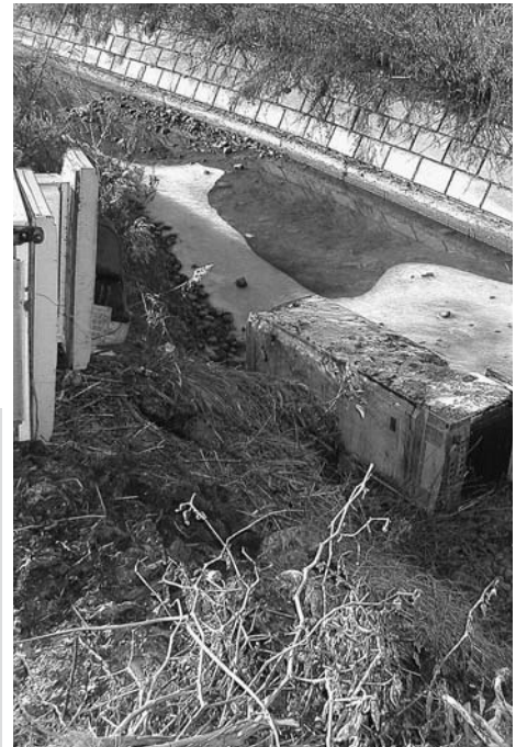
不法投棄された冷蔵庫

答 住民生活課長 廃棄物監視員の報酬が87万円、処理費用が52万5千円、地域清掃推進事業奨励金が3万円です。対策としては、廃棄物監視員による町内の巡回、悪質なものについては下野警察署、県