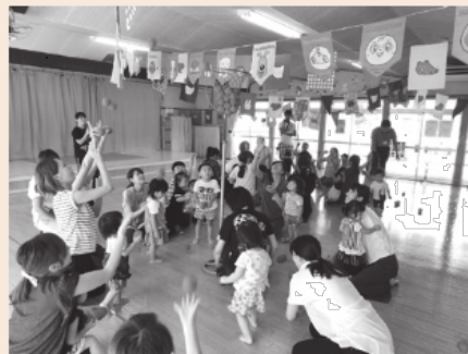
去年の運動会の様子 体をたくさん動かし、楽しみました！！