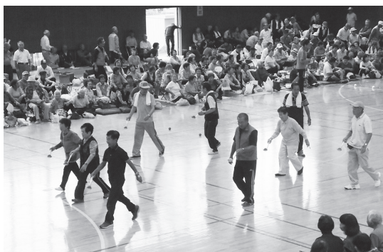
元気に体を動かそう