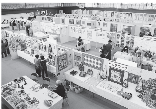
体育センターには様々な作品が並びました