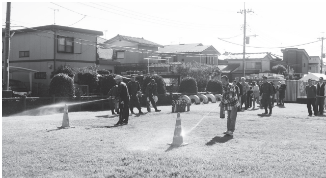
水消火器による訓練風景