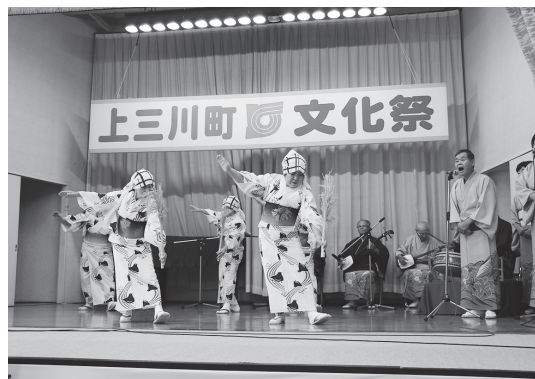
大洗町交流ステージの様子

また、体育センターでは絵画や書道など多くの作品が展示されていました。また、茶道の体験コーナーもあり、出展者の方も来場者の方も、皆で楽しいひとときを過ごしました。