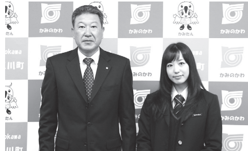
左から株式会社古口工業、上三川高等学校生徒会