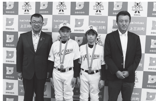
今後の活躍に期待します

報告に来てくれた選手たちは優勝できなかった悔しさと来年行われる春期全国大会への意気込みを語ってくれました。