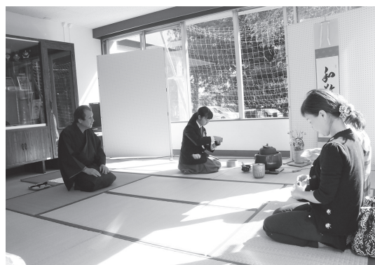
畳の上で茶会も開催