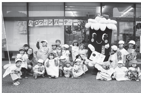
かんぴょうまっきーといっしょに集合写真