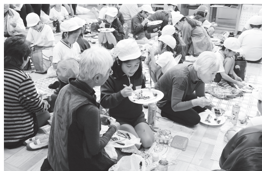
旬のサンマがおいしそう!!

サツマイモとサンマは小学校の校庭で焼かれ、校庭いっぱいに食欲をそそる香りが広がりました。