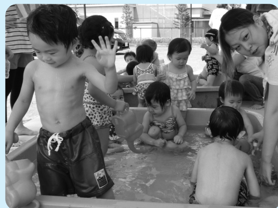
プールで水遊びを楽しむ子ども達