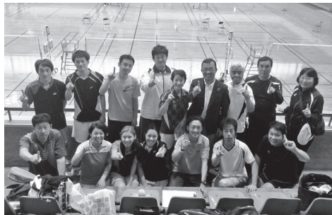
優勝したバドミントン選手の皆さん