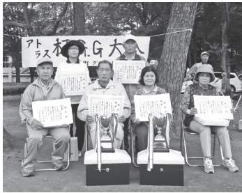
アトラスかみのかわ杯受賞者の皆さん