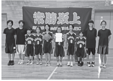
坂上 MBC の皆さん