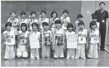
明治 MBC の皆さん