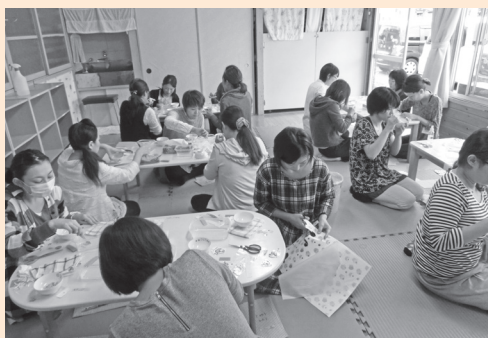
ママの製作教室ポーセラーツを楽しむママたち