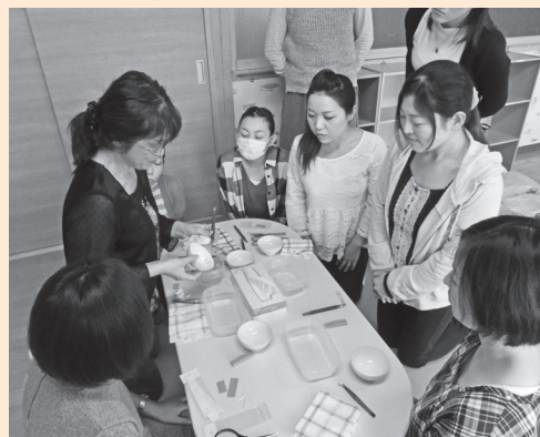
『こんなに集中したのは久しぶり!』っと、かわいいお茶碗作りに夢中でした。