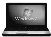
会場で機器お選び頂けます