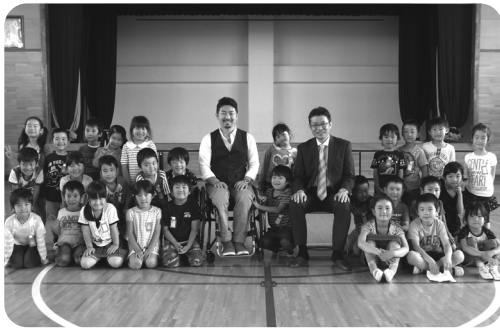
最後はみんなで記念撮影!!