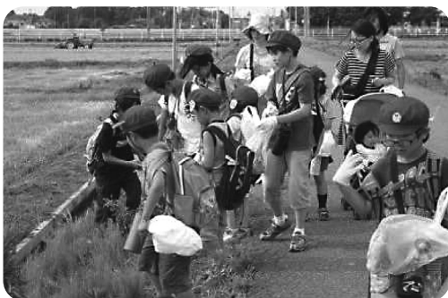
通学路の清掃活動