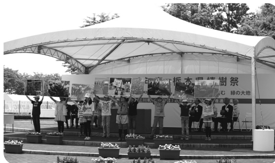
北小学校緑の少年団による活動発表