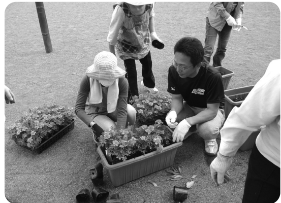
プランターに花を植える並木自治会