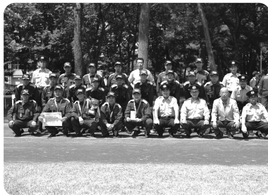
小型ポンプの部優勝の第1分団第4部