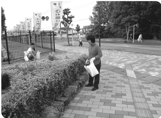
峰町自治会での環境美化運動

参加団体=56団体 参加人数=3,600人 花内訳= サルビア 7,930鉢 マリーゴールド 7,500鉢 シバザクラ 950鉢 パンジーの種 190袋