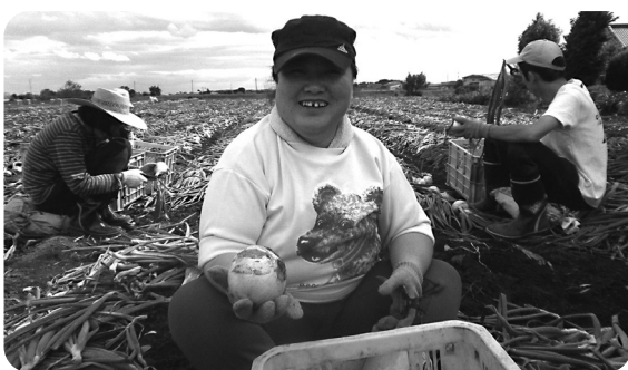
大きなたまねぎが収穫できました!!