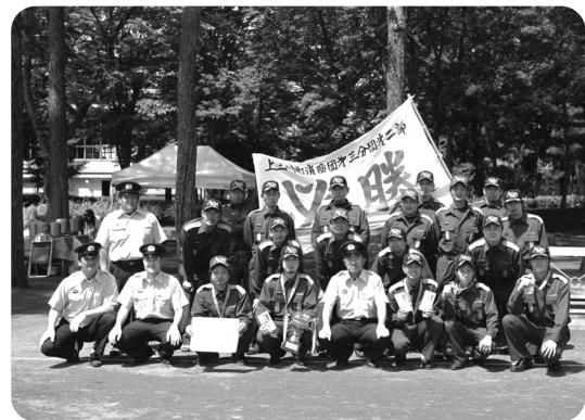
ポンプ車の部優勝の第3分団第2部