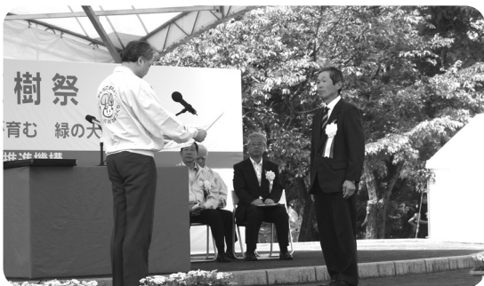
上神主・茂原官衙遺跡振興会への表彰の様子

県内全市町で開催され、今回が最後の栃木県植樹祭。来年から新たな形で緑化推進活動を進めていきます。