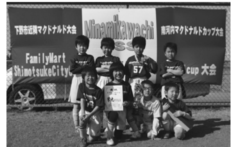
上三川町サッカー教室