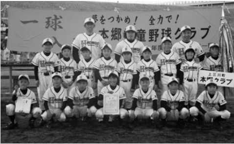
優勝した本郷学童野球クラブ