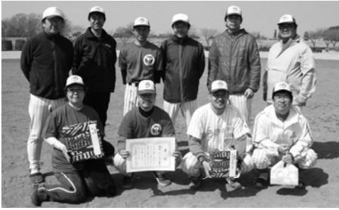
2部リーグ優勝のゆうきが丘第2