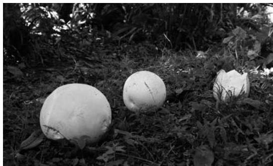
カラーの写真は、町ホームページで確認できます