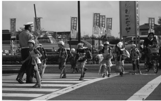
各種団体による街頭指導