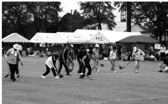
皆さん、お掃除は大得意!?