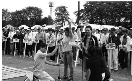
元気いっぱい、選手宣誓!

競技の合間に行われたフォークダンスなどのアトラクションには、たくさんの拍手が送られました。