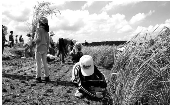
稲刈り体験に挑戦