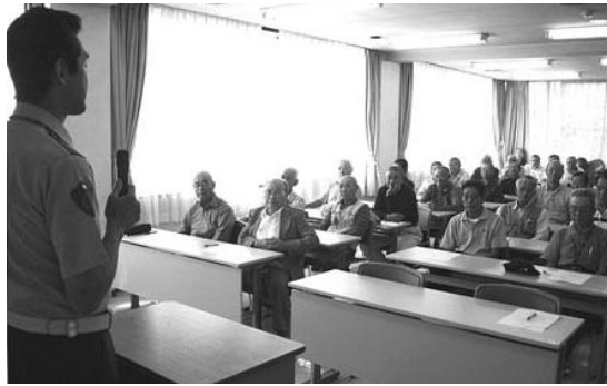
シルバー人材センターによる交通安全教室