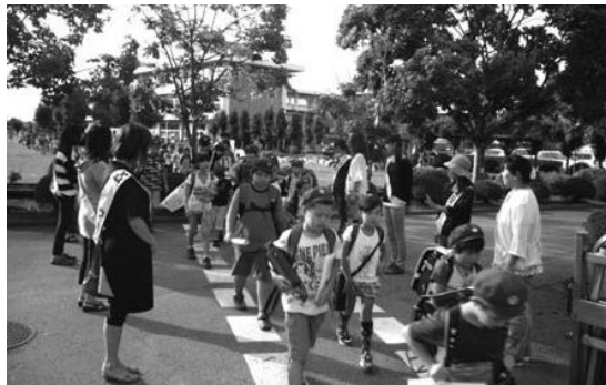
交通安全母の会によるひと声運動