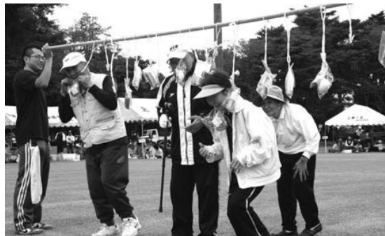
好みのパンをゲットできましたか?