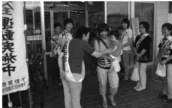
交通安全協会女性部会による街頭啓発