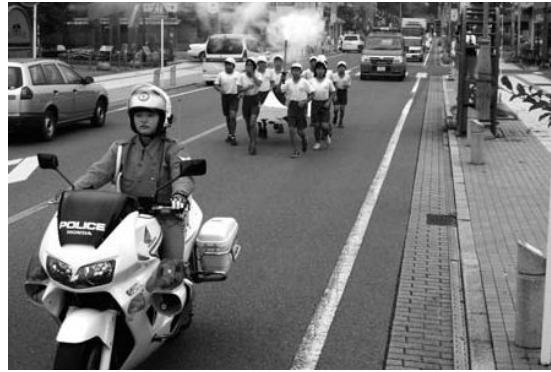
上三川小学校児童による火のリレー