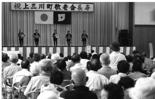
文化協会によるアトラクションを楽しみました