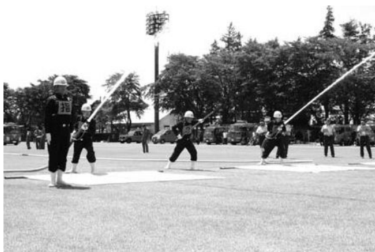
第2線放水はじめ(ポンプ車の部)