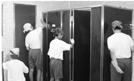
一所懸命に清掃する生徒たち