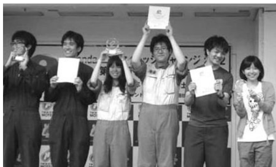
表彰式で満面の笑顔