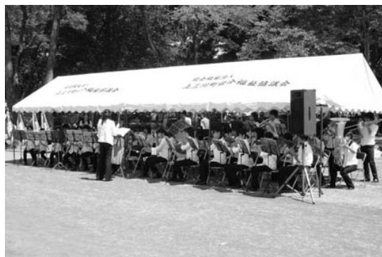
大会を盛り上げた明治中学校吹奏楽部