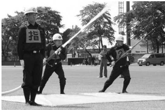
放水はじめ(小型ポンプの部)