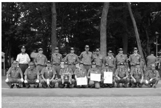
ポンプ車の部で優勝に輝いた第1分団第1部