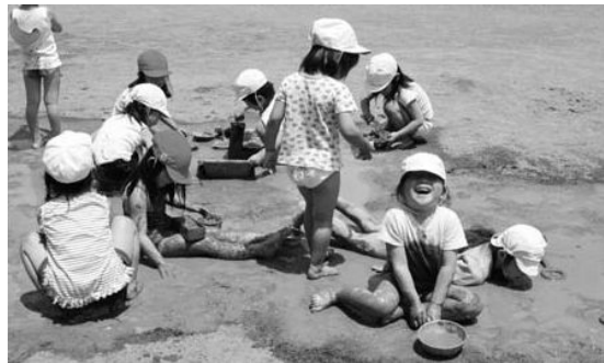
泥だらけになって遊ぶ園児たち