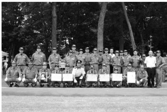
小型ポンプの部で優勝に輝いた第1分団第4部