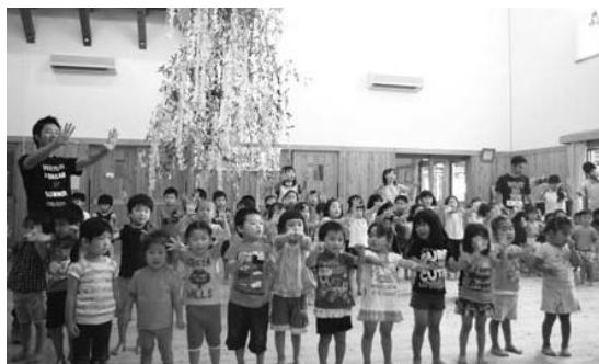
きれいな七夕飾りができました