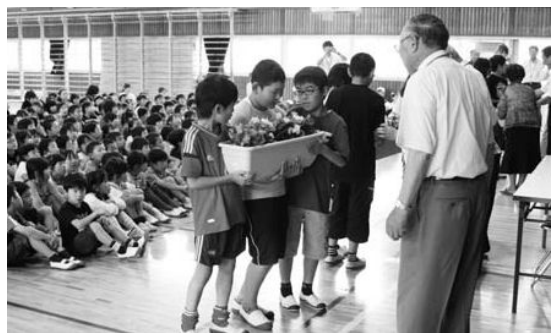
人権擁護委員さんから「人権の花」の贈呈

「人権の花」運動は、地域人権啓発活動活性化事業の一環として、児童が協力して花を栽培することで、思いやりの心を育て人権への理解を深めることを目的に行っています。人権擁護委員から、ペゴニア60株とプランターが贈呈されました。