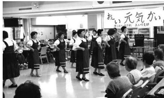
皆さんに楽しんでいただきました