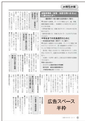
広告スペース 半枠