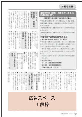
広告スペース 1段枠