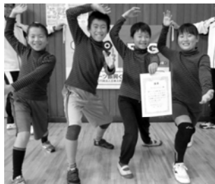
優勝したアバレンジャー