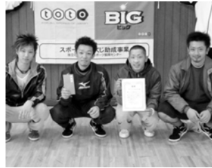
優勝したざつくりJAPAN