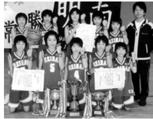
優勝した明南ミニバスケットボール スポーツ少年団