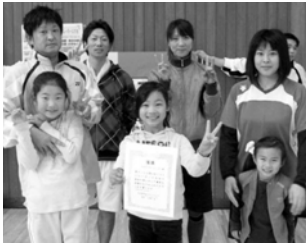
優勝したピキピキキービツキー