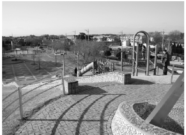
空間を利用した公園でひとやすみ