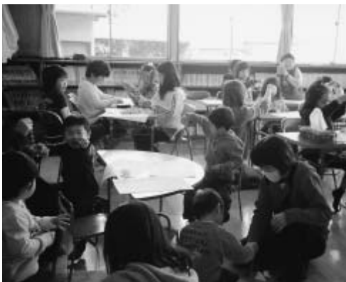
よくまわるUFOキャッチャーをつくっています（願成寺児童館）