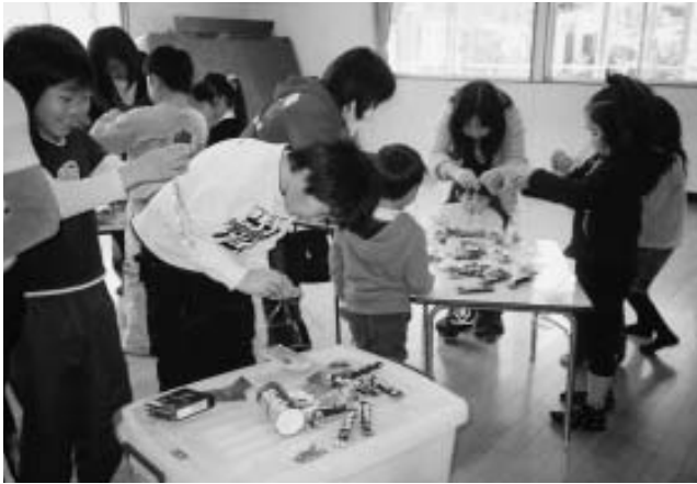
UFOキャッチャーゲームぜんぶとってやるぞ！（願成寺児童館）