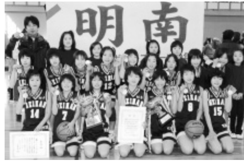
全国大会出場を決めた明南ミニバスケットボール