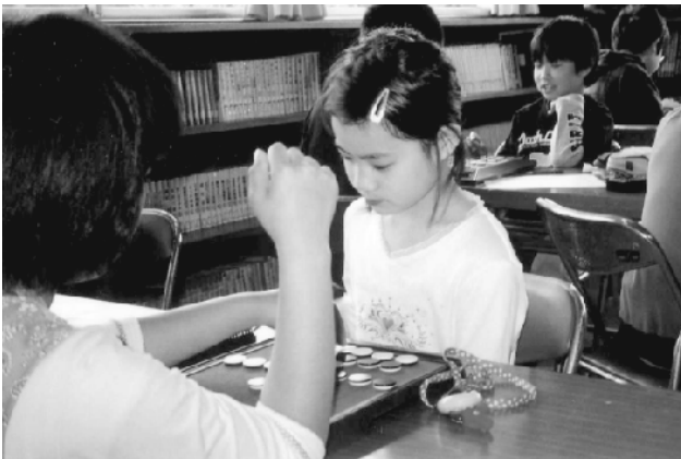
昨年のおセロゲーム大会（願成寺児童館）