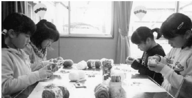
つくってみよう！（蓼沼児童館）

その他＝材料費等は無料ですが、はじめての人が大勢の時は、マンツーマン指導に時間がかかるので、少しおまかせすることがあります。