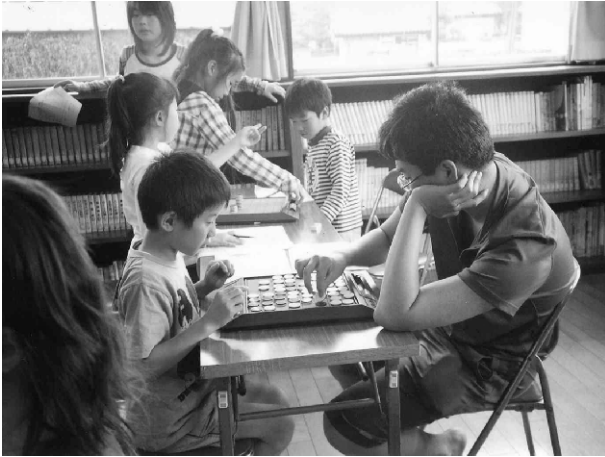
小学3年生と中学3年生の真剣勝負！（願成寺児童館）