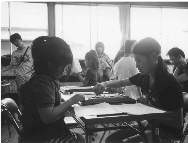
女の子どうしの戦い！どちらもがんばれ！（夢沼児童館）